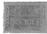
復員時の個人携行物品明細書