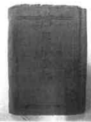
軍隊手帳 中には全ての書類が大切に取られています。

柴野さん、取材させていただき本当にありがとうございました。（取材・文責：三村康彦）