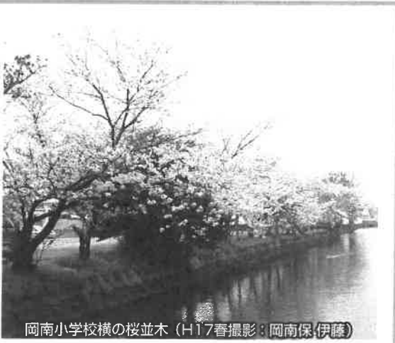
岡南小学校横の桜並木 (H17春撮影：岡南保伊藤)

製造元は岡町の市川商店。マルナカなどのいくつかの店舗にも置いてあるらしいけれど、製造元で買う方がおトクです。肉厚のひねったかりんとうにナッツをまがしたもので、香ばしさと少々固めの歯ごたえがクセになります。職場でも人気のお菓子です。(よ)