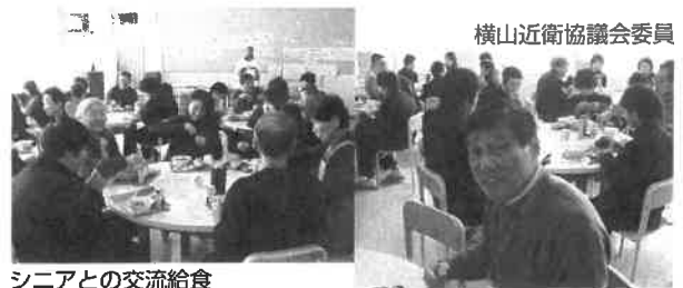
シニアとの交流給食