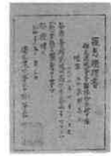
独立混成部隊による熱帯熱罹患証明書