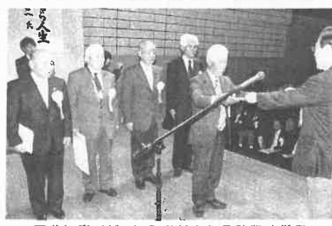
石井知事(右)から表彰される防犯功労者