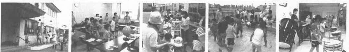
岡輝公民館 にがうり同好会