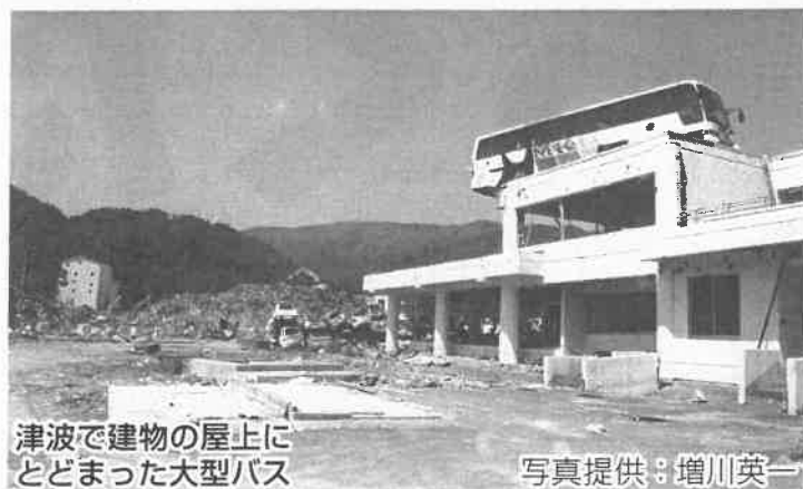
津波で建物の屋上にとどまった大型バス