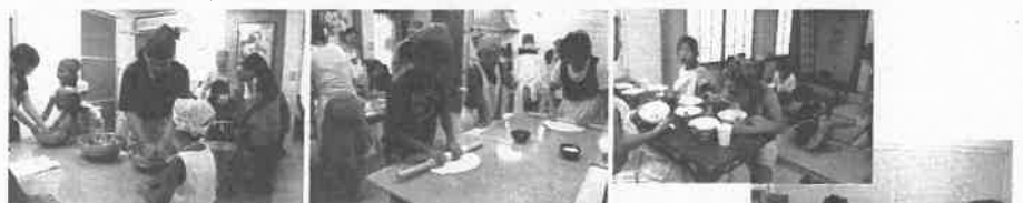
プラザ岡輝 8/19 夏休み うどん作り教室 小学生とその保護者を対象に「麵'S工房岡輝」の指導をしていただきました。楽しく作り、おいしくいただきました。