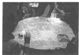
アイデアを出し合いながらシミュレーションをします。

中学生・先生・保護者をはじめ町内会・消防団等・地域の方々72名の参加者によりグループにわかれ、岡山市全地域震度6強 2月〇日(金)午前11時に大地震発生という条件のもと、避難者カード・イベントカードを避難所に見立てた体育館・教室・校庭の平面図上に配置していきます。色々な条件の避難者カードをどのように配置するか色々なアイデアが出てくる中、カード記載のさまざまな問題点を考慮し、避難者の要望・希望を確認した上でカードを配置していました。簡単なカードと対応が難しいカード、そして参加者でも理解に苦しむカードと苦戦しました。