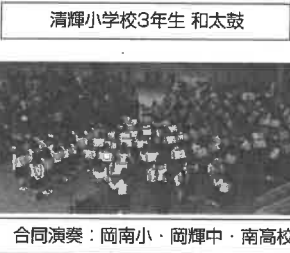
合同演奏：岡南小・岡輝中・南高校