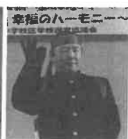
シニアスクール清輝教室 合唱「四季の歌・春のメドレー」