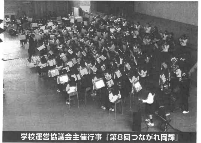
学校運営協議会主催行事「第8回つなぐれ岡輝」

岡輝中学校区の学校園は、全国に先がけ、平成14年度～16年度に文部科学省から「コミュニティ・スクールに関する法案づくりのための実践研究」の指定を受けました。その後、「コミュニティ・スクールを全国に広める