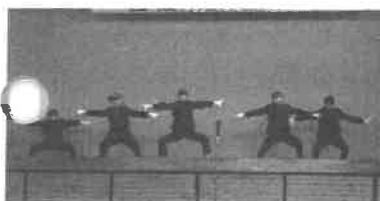
岡輝中学生徒会有志と片山校長の応援エール