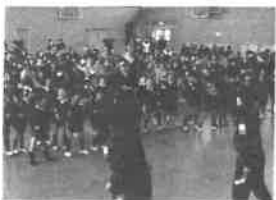
岡山南高校 生活創造科 2年生 保育発表