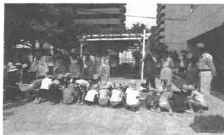
子どもたちとの交流