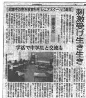
山陽新聞2013年2月9日号掲載