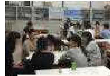
岡輝中学校を会場に行われた奥田地区の懇談会の様子

6月23日(金)と30日(金)に、岡輝地区青少年育成協議会が主催する【みんなで語ろうの会(町別懇談会)】が学区8会場で行われ、地域・保護者・教職員が参加し、子どものこと、地域のこと、困っていること、悩んでいること…、地域の大人が集まり、子どもたちが育つ地域づくりについて話し合いました。