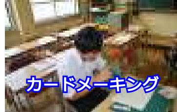
カードメイキング

今年は14講座が開設され、1年生とシニア生の皆さんが楽しみました。昔から親しまれているものや新しい時代のもの。講座は変わることはあっても、地域の方と生徒のつながりはいつまでも変わりません。