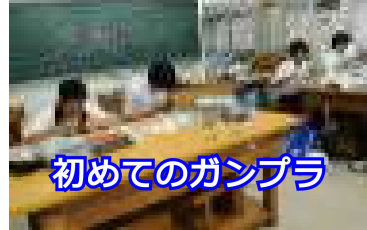
初めてのガンブラ