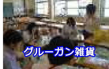
グループガン雑貨