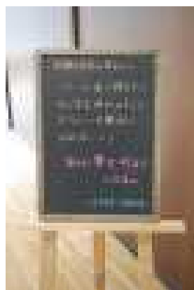
校長室前のメッセージも 願いました