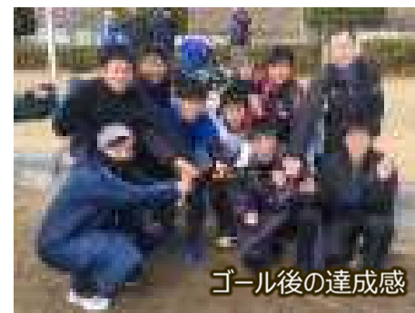
ゴール後の達成感

この駅伝は一般男子1部に、昨年末の全国高校駅伝を制覇した倉敷高校チームも参加するほどのレベルの高い大会です。6人のランナーは、強豪の高校生や実業団チームと渡り合い、2部で19位（完走チーム41チーム）でゴール。タイムは1時間25分09秒で、これは強豪がそろそろ1部でも15位に相当する素晴らしいタイムでした。