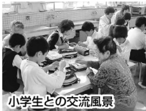
小学生との交流風景