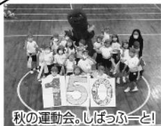
秋の運動会。しばっぶーど!

記念事業の一つとして、子どもたちが世界に目を向け、夢をもってもらえるように、清輝小学校の卒業生で長く日本航空にお勤めになっていた方に、豊富な海外での生活経験に基づいた記念講演会をしていただきました。また、秋の運動会も創立150周年記念と銘打って実施しました。(余公)