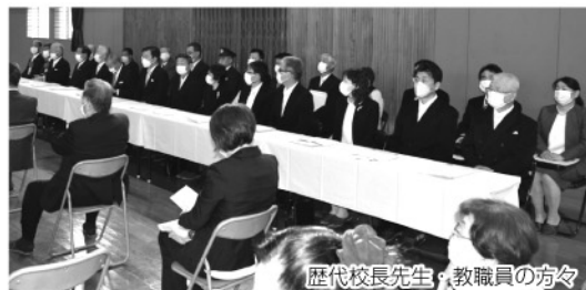
歴代校長先生、教職員の方々