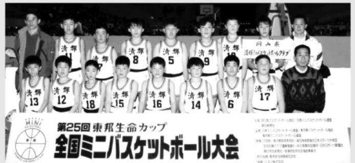
第25回全国ミニバスケットボール大会にて。 後列左から3番目が私です（背番号7番）。

りをしています。一番長い先生は1年生の担任の先生ですので、34年になりますね。清輝小の先生方は、とても一生懸命に子どもたちと向き合ってくれることが、今でも変わっていないと思います。それに加えて、多くの卒業生を中心に地域の皆様も清輝小学校を支えているからこそ、150周年という伝統が守られていると思います。これから先もこの伝統が続くよう、地域の一員として少しでもお手伝いできたらと思います。