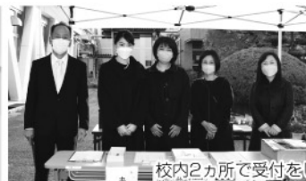
校内2カ所で受付をして頂きました