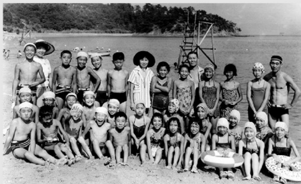
本島の時の写真です。2列目左から3番目が私です。

この清輝学区は地域のまとまりが非常に良いと言われています。これからも益々、高齢化社会になっていきますが、三世代共に助け合い、住みやすい地域にしたいと思っています。