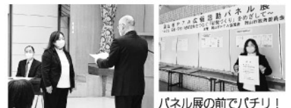
パネル展の前でバチリ!