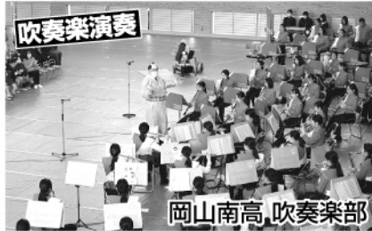
岡山南高 吹奏楽部