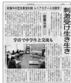
山陽新聞2013年2月9日号掲載

〈参考例〉令和4年度～5年度(将来改訂されることがあります。) 岡輝教室(月5,000円)・清輝教室(月4,000円)・岡南教室(月3,000円) [8月を除く11回納入していただきます。]