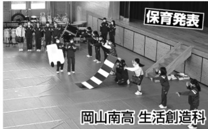
岡山南高 生活創造科