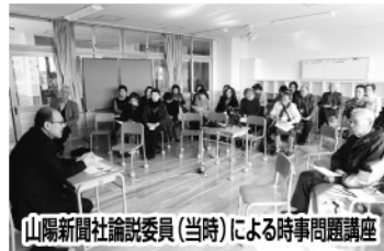
山陽新聞社論説委員(当時)による時事問題講座