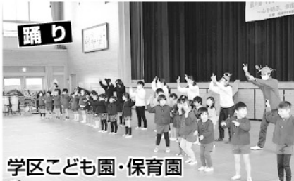
学区子ども園・保育園