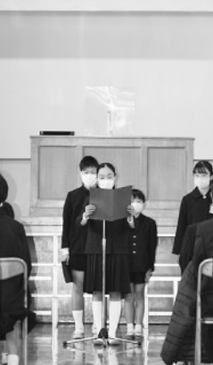
在校生の演奏で式典を盛り上げました