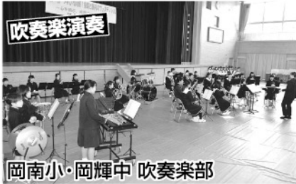
岡南小・岡輝中 吹奏楽部