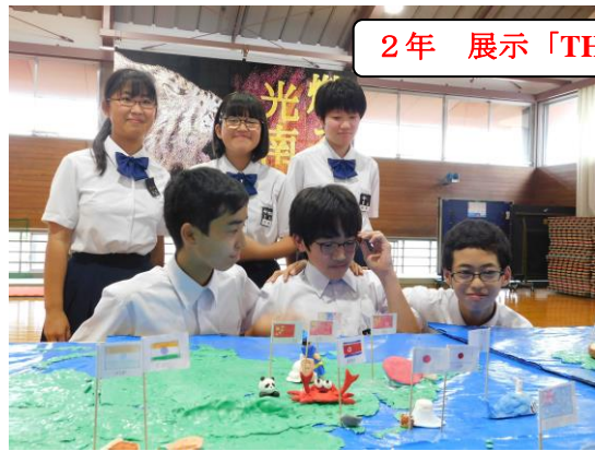
2年 展示「THE WORLD」