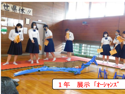
1年 展示「オーシャンズ ガーベッジ アート プロジェクト」