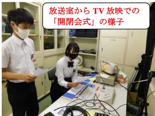
放送室から TV 放映での「開閉会式」の様子