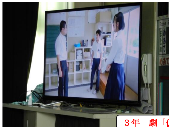
3年 劇「仮面」のビデオ上映