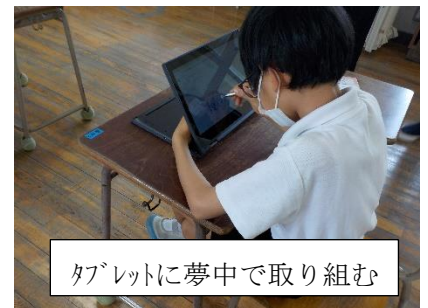
タブレットに夢中で取り組む