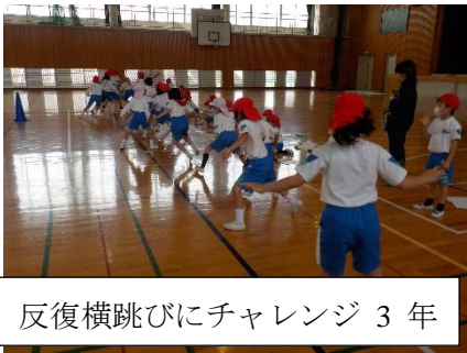
反復横跳びにチャレンジ 3年

5月下旬から、子どもたちの体カテストが行われています。昨年度は、休校などがあり行われなかった体カテストですが、コロナ禍で子どもたちの体力はどのように変化しているか気になるころではあります。体育の時間も密を避けて、感染予防に気を配りながらクラスごとに体カテストを行いました。