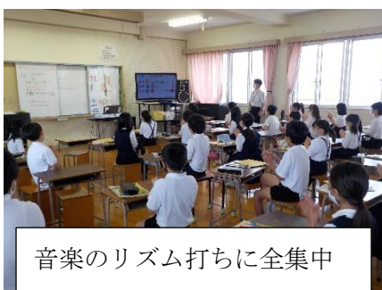
音楽のリズム打ちに全集中