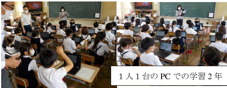
1人1台のPCでの学習 2年

昨年度末から全国に広がっている GIGA スクール構想によって、児童一人につき 1 台のタブレット PC が配付されています。このタブレットを授業に活用する学習がすべての学年で始まりました。しかし、初めての試みでなかなか指導する側も扱う児童も最初からすいすいとはいきません。使用する前の設定やネット環境の確認が大変です。電子機器ですから、不具合があることもタッチミスもあります。しかし、今までパソコンを利用するために北館 4 階まで行っていたものが、各教室でできるため便利な上パソコンが非常に身近なものになります。デジタル教科書も少しずつ増えてくると思いますが、アナログとデジタルを上手に使い分けてそれぞれの良さが生かされるように指導者も研修を積んでいきます。