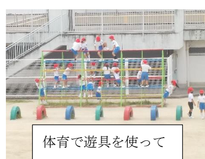
体育で遊具を使って