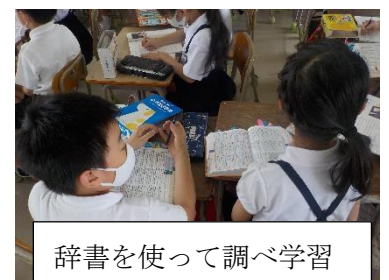
辞書を使って調べ学習