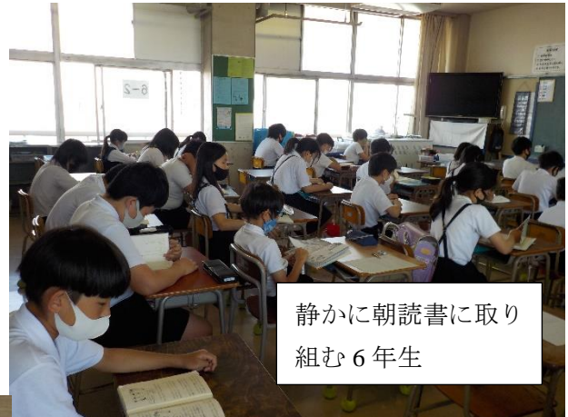
静かに朝読書に取り組む6年生

新型コロナウイルス感染拡大で緊急事態宣言が出され、休みの日もどこにも行けずに退屈していることが多い日々が続いています。今年は、梅雨入りも早く自分自身が体を動かして体験したり、いろんな場所でいろんな人と出会ったりする機会も減っています。緊急事態宣言が出てからは、私も毎朝校門に立つこ