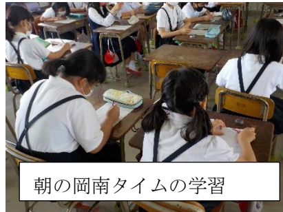
朝の岡南タイムの学習