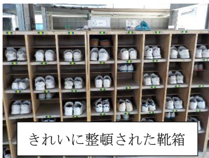
きれいに整頓された靴箱