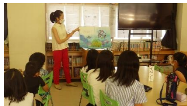
読書ボランティアさんによる読み聞かせ