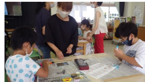
夏休みの課題にチャレンジ