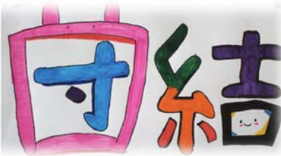
↑ 5年生、オリジナルのうさぎデザイン

「どうしてこんなめあてになったの?」「このめあてで、みんなは何をしようと思うの?」と子どもたちに質問すると、どの学級でも「安心」「努力」「協力」など学校生活を支えるキーワードが返ってきます。先生や古都っ子たちがふだんからそのことを意識し、大切だと思っている様子がよく伝わってきました。こ