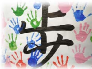
↑ 2年生はみんなの手形付き

どの学級のめあても、前向きにけんめいにやろうという気持ちが込められたものばかりです。