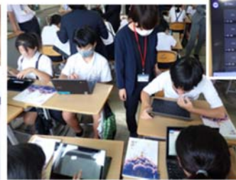
↑写真3 「グループ内で話し合い」