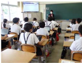
↑写真1 「なぜ共感できる？」

前の時間に子どもが選んだ「自分が共感や納得ができる投稿」を読み、それが優れている理由を考えるという活動から授業が始まりました（写真1）。今年度、クロームブックに導入された「ムーブノート」というアプリで提示された教材（投稿文）を読み、「投稿者が説得力を高める工夫をしている」と思う表現を探してラインを引いたり、そう考えた理由をアプリの付箋機能で書き添えたりしました（写真2）。