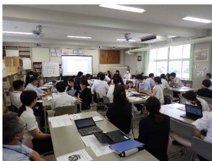
「授業後、協議会の参加者セッションと指導講評」

40名以上の参観者があり子どもたちは終始緊張していましたが、本校の研究テーマ「認め合い 自分の考えを深める子どもをめざして」に沿って構想した「ICT機器を活用した協働的な学び」の一端を公開することができました。また、「子どもたちが語り合い深め合う場を大切にしてほしい」といった従来の授業づくりでも大切にしてきた視点について改めてご示唆をいただく等、授業者を含め研究に携わった者全員が多くの学びを得る機会となりました。計画段階から本校研究に対して細やかにご指導いただいた岡山市教育委員会事務局の先生方をはじめ、当日ご参加いただいた旭東中学校区学校の諸先生方のご指導、ご助言を今後の校内の実践に反映させていきたいと強く感じた一日でした。