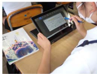
↑写真2 「最初は各自で考える」