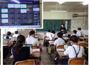
↑写真4 「全員で送り手の工夫を共有」

次に、小グループごと意見を共有し、グループ内で投稿された内容を分析しました（写真3）。子どもたちが入力した情報は、クラス内、グループ内ごとに手元の端末の画面上で共有でき、教室のあちらこちらで話し合いが始まりました。投稿から「自分の経験をもとにして表現している」「根拠をもとに書いている」「ことわざを使っている」等、説得力を高めるための工夫を見つけたり、「ムーブノート」のカードを動かしてマーカーでくくってまとめたりする活動に取り組んでいました。