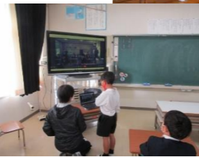
表現力を高める指導