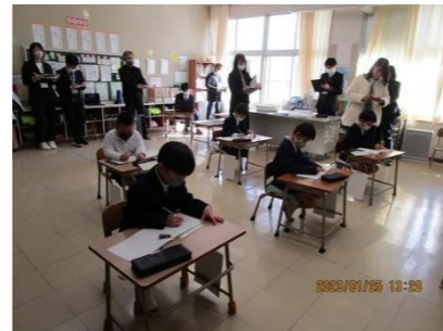
①主体的に学び合う授業づくり