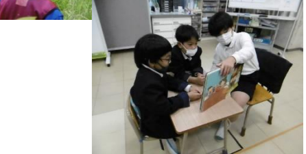
②異学年交流・活動の充実