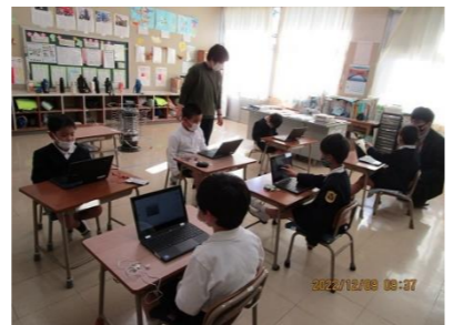
基礎・基本の定着