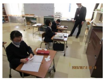
③少人数の利点を生かした指導の充実