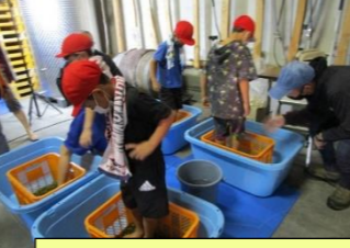
ふるさと・自然のよさを感じる活動の推進