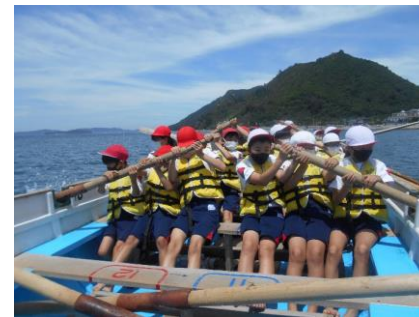
力を合わせて!クラスでよく息がっています。