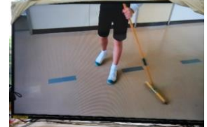
ほうきは引くようにして使う、という、良い掃除の仕方を啓発する動画