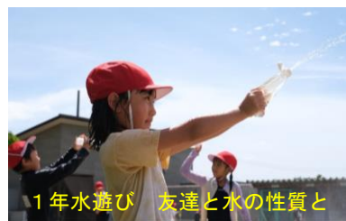
1年水遊び 友達と水の性質と