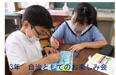
3年 自治としてのお楽しみ会