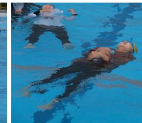
体から力を抜くと、不思議と浮きやすくなります。

夏是水遊びなどでの水難事故が非常に多い時期です。着衣での泳ぎにくさを体験し、浮き方、浮きになるものの利用などを学びました。とはいえ、川や海では子供だけにしないなど必ず気を付けたいものです。