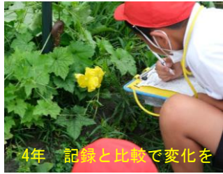
4年 記録と比較で変化を

1学期間、子供たちは一生懸命に頑張りました。人とつながり気持ちを交わすこと、これまで感じたことのない感覚や喜びを得ること、自分や学校生活を見つめ望ましいと思うことを頑張ることなど、様々なことに頑張る1学期となりました。本当に立派でした。