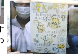
節電を呼びかける校内放送