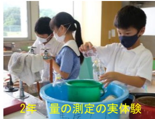
2年 量の測定の実体験