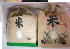
会の運営や、お礼のお米の準備など、5年生ががんばってくれました。

田植えや稲刈りなど、まやしもっ子農園を助けていただいた方をお招きし、音楽発表会の曲を演奏しました。皆さん、大変喜んでくださいました。涙を流して感激して下さった方の姿などに、子供も心打たれていました。