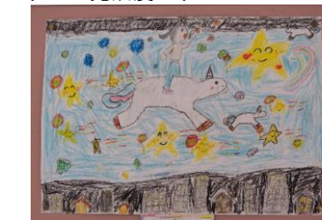
廊下には楽しい作品がいっぱい!わくわくします!