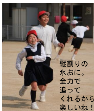
縦割りの水おに。全力で追ってくれるから楽しいね!