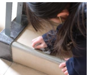
(右) 階段の溝のほこりを、細くした雑巾で丁寧にふき取っている子。そこまでもなくとも、と言っても納得しません。感謝を伝えると、当たり前のことだよという笑顔を返してくれました。

1年間、子供たちは頑張りました。行事や大きなことはもちろん、生活の小さな出来事その一つ一つに、柔らかな感性を働かせ、真剣に考え、明るく、楽しく、学校での暮らしを、がんばってつくっていきました。