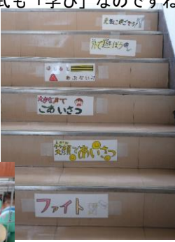
6年生の学校を良くする活動。学校への思いに、涙が出そうでした。