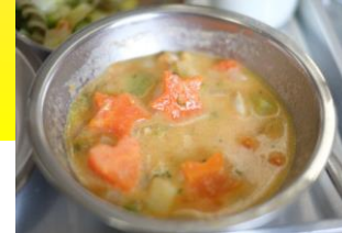
使用したにんじんを全て星などに型抜き!ととても大変なのにありがとうございました!