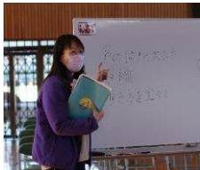
卒業式はどんな式がいいのか?そのための目当ては?と、考えさせていきます。考え実践する場。つまり卒業式も「学び」なのですね。