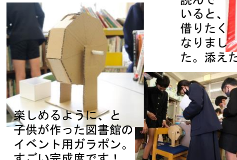
楽しめるように、と子供が作った図書館のイベント用ガラポン。すごい完成度です!