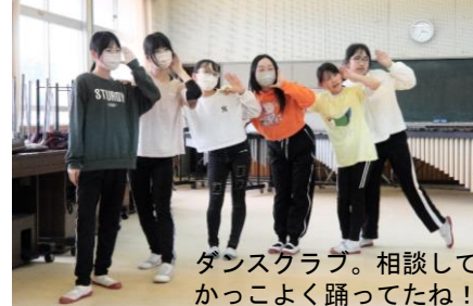
ダンスクラブ。相談してかっこよく踊ってたね!