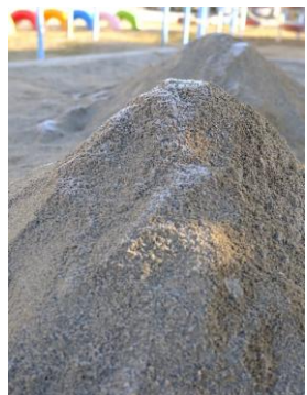
(上) 「雪山だよ!」と駆けてきた子。前日遊んだ砂の山が、確かに雪山に。霜などの自然現象に関心を寄せるようになりました。