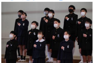
6年はさすがの態度と歌声です!