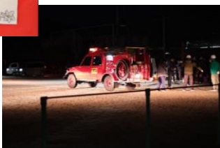
暑い日も雪の日も見守りをしてくださって、本当に感謝いたします!