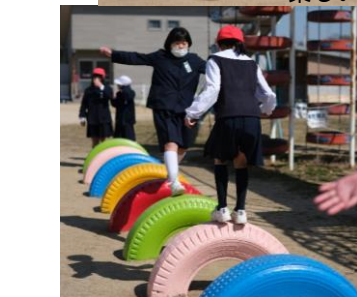
タイヤのペンキを塗り替えると「学校が明るくなった!」と喜んで話してくれました。