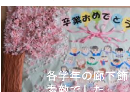
各学年の廊下飾り。素敵でした。