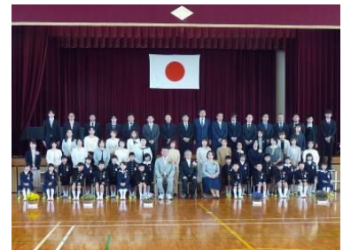
入学式後の写真撮影

4月13日【1年生通学班で登校開始】慣れない登下校にもくじけることなく、元気に登下校し、大きな声であいさつ。気持ち良いです。「頑張ったね、また明日」と声をかけながら、明日が来るのが一層楽しみになります。手を引いたり、荷物を持ってあげたり、歩くペースを合わせたり、上級生の優しい心配りが光っています。