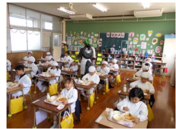
4月19日 1年生の給食風景

4月20日【避難訓練（火災）】新学年の避難経路を使って、無言で素早く避難できました。