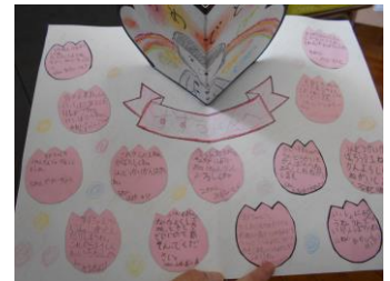
メッセージカード

4月18日【1年生給食開始】記念すべき初めての給食は「麦ごはん、いももち汁、白身魚のごまがらめ、牛乳」でした。1年生の皆さん給食はどうでしたか？