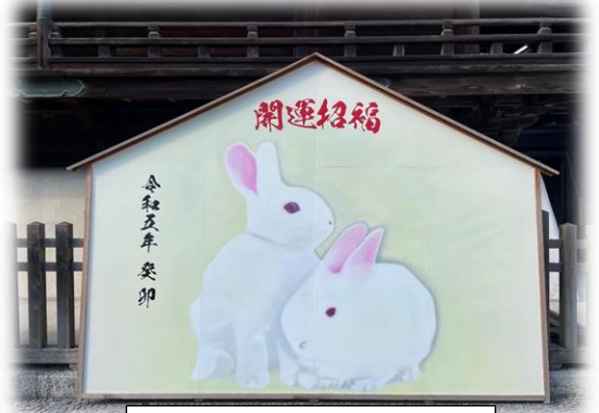
吉備津神社の奉納絵馬

今年の正月は寒さも幾分か緩み、過ごしやすかったのではないのでしょうか。ご家族皆様で、穏やかな新年を迎えられたことと思います。登校した子どもたちの表情からは楽しい冬休みを過ごしたことがうかがえました。