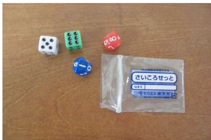
10面体と双六サイコロセット