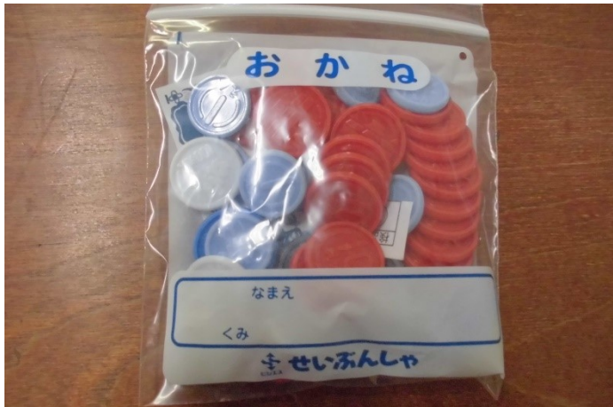
おかねもけいセット