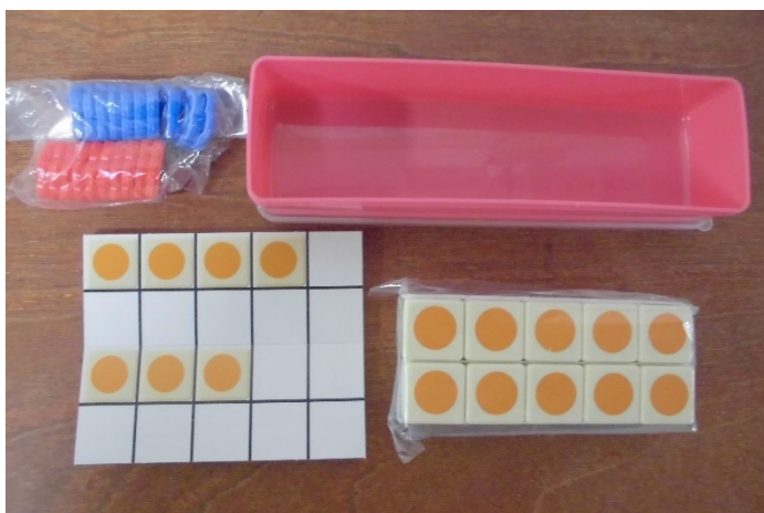
数図ブロック (おはじき入)