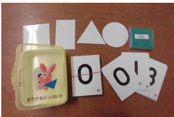
すうじいろいろいたセット