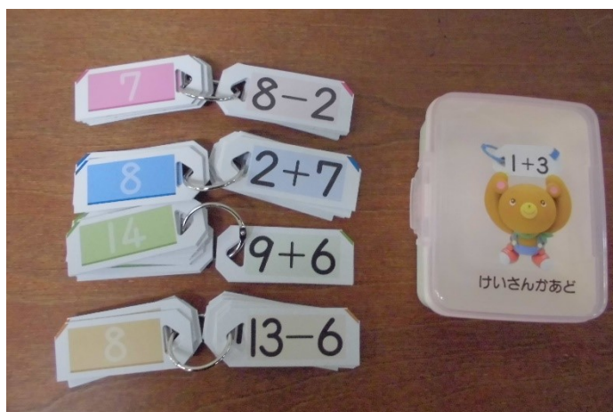
けいさんカードセット たしざん (1) ひきざん (1) たしざん (2) ひきざん (2) があります。