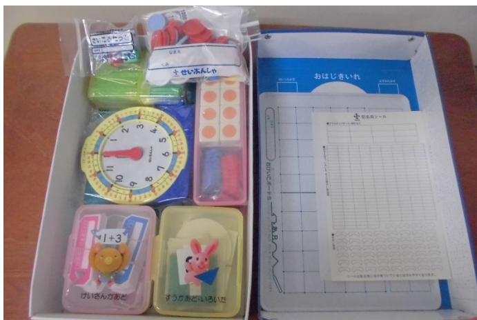
さんすうぼっくす (10点セット)