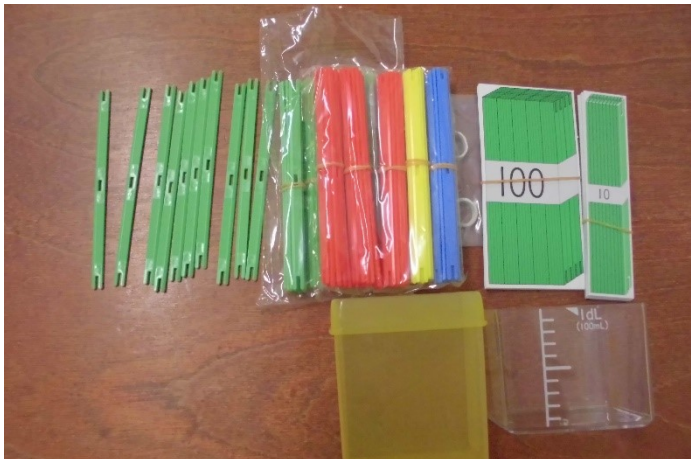
かぞえぼうセット