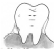
歯垢が残っている 歯石が沈着している