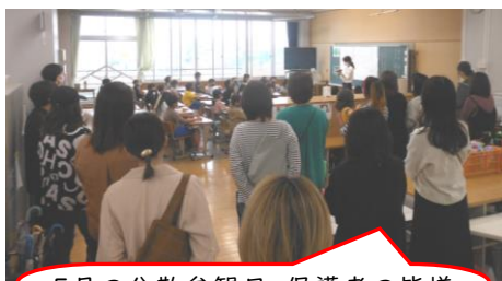
5月の分散参観日。保護者の皆様にはオープンスペースからでしたが、熱心にご覧いただきました。

< 1学期の出来事より > ※5年海の学校(6/22)、4年山の学校(7/13)は9月号で紹介します。