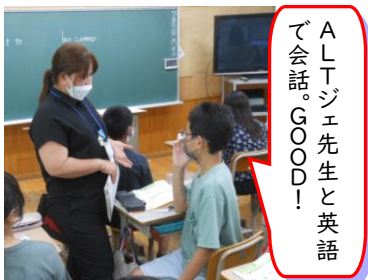
ALTジェ先生と英語で会話。GOOD!