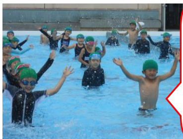
「屋上のプールは気持ちがいいなあ!」