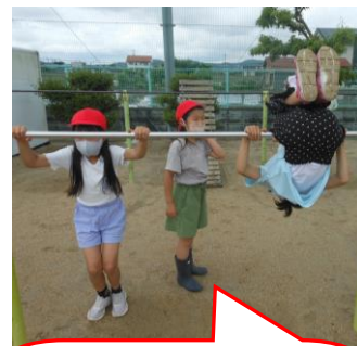
操明っ子は外遊び大好き! 好きな遊具で遊んだり、運動場を駆け回ったり…。