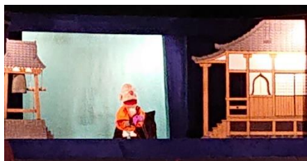
記念公演人形劇「ごめんね シロ」

この創立記念に向けては、子どもたちも「わたしたちの学校」のために何ができるか、と「感謝」の気持ちをもって150周年を祝い取組をいろいろと考えてくれました。清掃活動は言うまでもなく、1・2年生は「おめでとう」の花、3年生は「曾根小の自慢」を描いた絵皿、4年生は「マスコットキャラクター」を考えたメッセージカードを作成し、廊下掲示等で学校をきれいに飾ってくれました。5年生は、学校に感謝の気持ちを全校の一人一人が伝えるためのメッセージカードを手作りし、全校分を取りまとめて掲示してくれました。そして、最高学年6年生は、「ありがとう イーネ！ソーネ！」という大きな横断幕を作ってくれました。