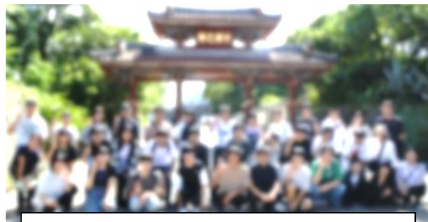
首里城は2026年修復に向け工事中です。

ホテル 道の駅かでな 首里城 国際通り班別研修(昼食) 那覇空港 岡山空港着 学校着