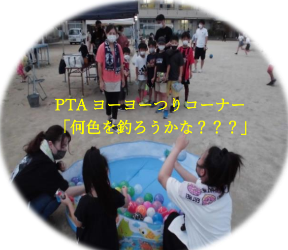
PTAヨーヨー釣りコーナー 「何色を釣ろうかな??」