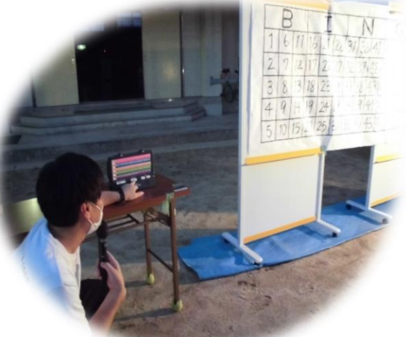
大人も本気、注目のビンゴゲーム。 もちろん豪華景品あり!!