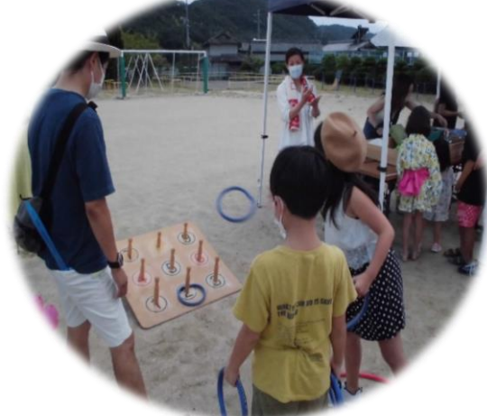
PTAわなげコーナー 「何点ゲットできるかな??」