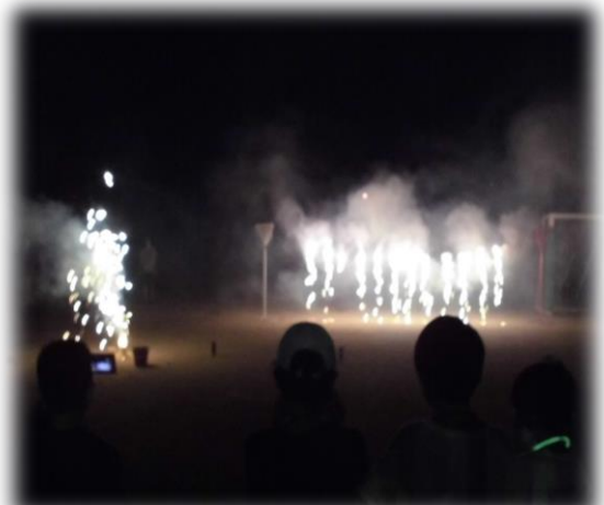
角山ナイアガラの滝!? 最高でした!!。