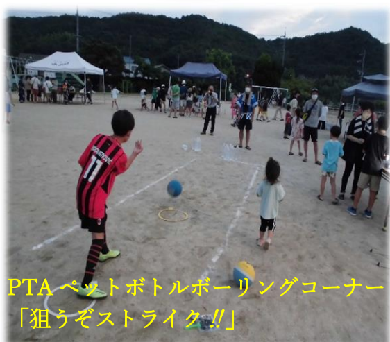
PTAベストボトルボーリングコーナー 「狙うぞストライク!!」