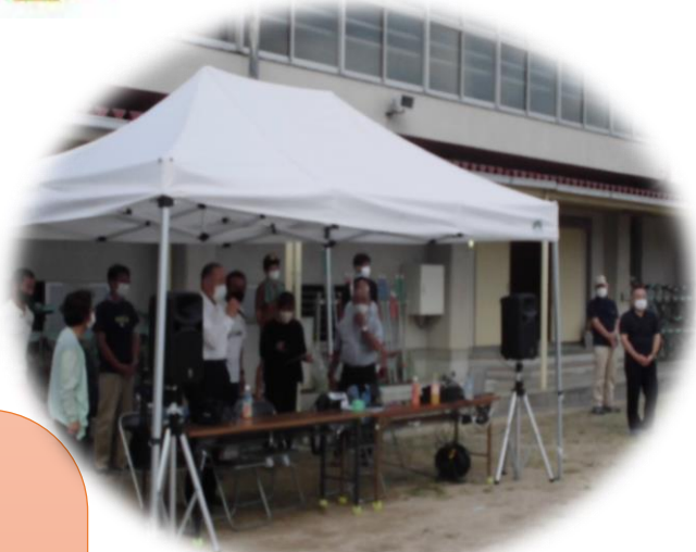
本部テント前で開会式♥ マスク着用などの感染防止対策も、 みんなで確認しました。

8月13日(土)に、久しぶりに角山夏祭りが開催されました。 数か月前から主催の角山コミュニティ協議会でも、新型コロナウイルス感染対策など、何度も慎重に協議・検討しました。 そして最終的に、食べ物もない、カラオケもない、でも子どもたちが少しでも喜ぶようにと、PTAが中心となって規模を縮小して開催しました。 参加した子ども達にとっては、楽しい夏の日の一夜となりました。 ご協力くださった地域の皆様、準備から片付けまで、本当にありがとうございました。