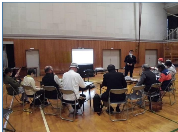
地域の方々・保護者（大人）は、火災発生の流れについて。