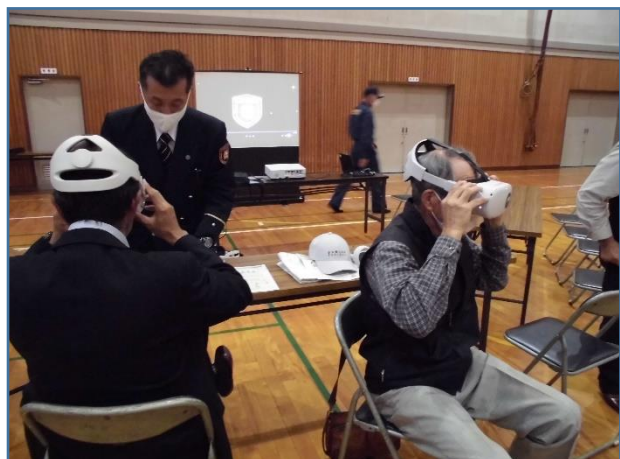
VR体験で、火災発生体験。