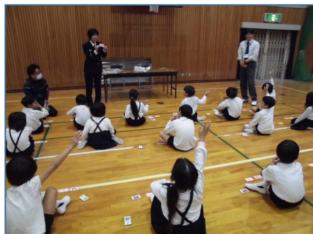
防火学習カード（消防署作成）