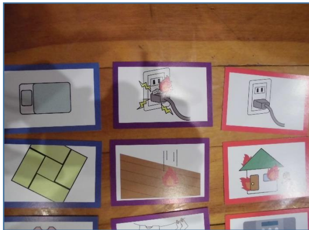
右から、コンセント、ほこり、近くの布団に燃え移る。