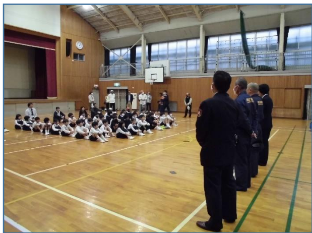
今回のテーマは、防火と火災時避難です。

この日は、開始予定の30分前から突然の暴風雨と雷。当初予定されていた起震車体験や水消火器体験が急遽中止となりました。しかし、岡山東消防署の方々と相談し、消防服をはじめ装備品紹介などに活動内容を変更してもらいました。非常に有意義な防災教室となりました。消防署員の皆様、ありがとうございました。