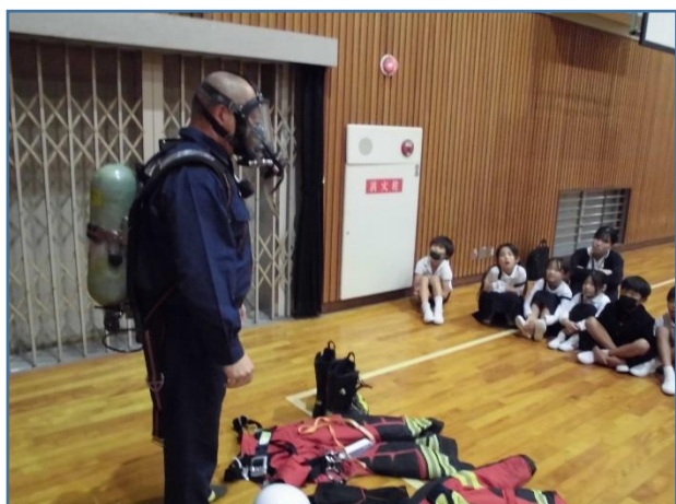
煙や有毒ガスを吸い込まないように！