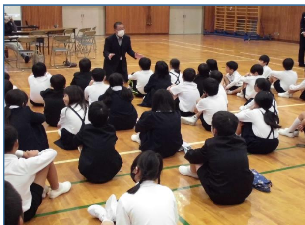
最後に上道公民館長さんから「生きること」、「命の大切さ」についてのお話を聞きました。