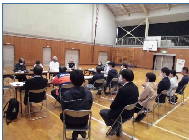
防災教室後、地域懇談会（教職員も参加）も行われ、学区の防災等地域の諸課題について話し合われました。