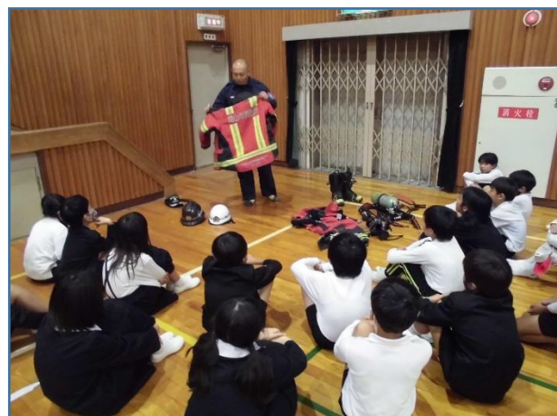
消防士さんの服の素材や特徴を聞きました。