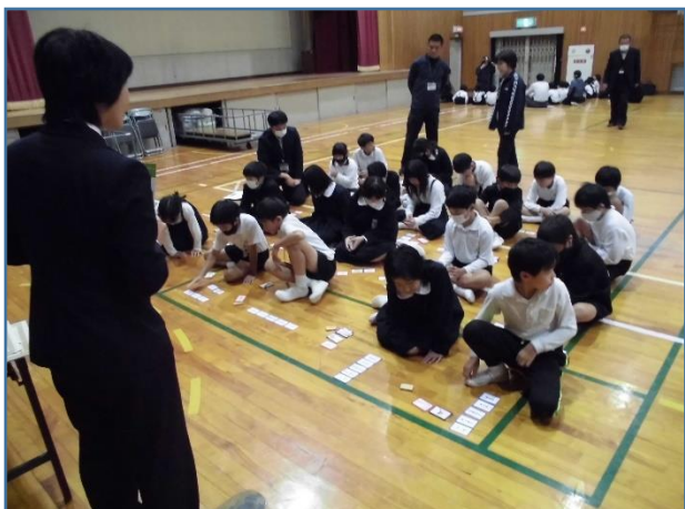
火元、原因、燃え移る物、3色並べて考えます。