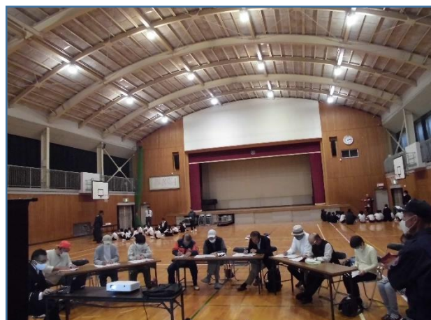
児童2グループ、大人グループの3グループで！